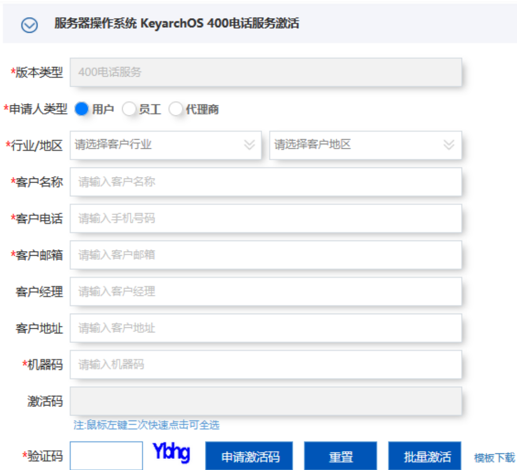
图 4 400 电话服务激活界面

在浪潮信息云峦服务器操作系统官网（服务支持 ->服务激活与查询） https://support.ieisystem.com/lcjtww/zcxz/kos/index.html 的“服务器操作系统 KeyarchOS400 电话服务激活”模块进行 400 电话服务激活码的申请。